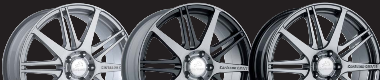
BRILLIANT EDITION 1/10 BE

ab € 3.710,40 inkl. Wuchten, Montage und MwSt.