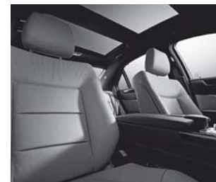
Lederpolsterung (Beispiel zeigt Avantgarde mit Lederpolsterung)