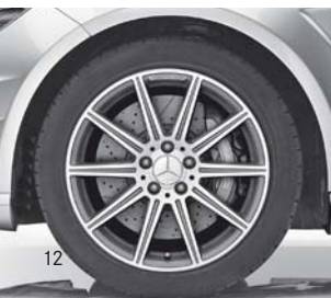
AMG Leichtmetallrad (796)