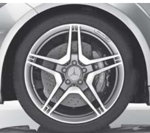
AMG Schmiederad (793)