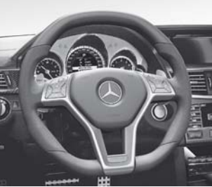
AMG Performance Lenkrad