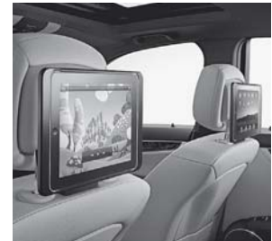
Apple iPad 2® Fond-Integration Plus