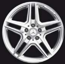
AMG 5-Doppelsp.-Design (791/795)