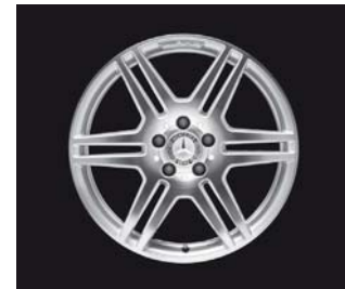
AMG Doppelsp.-Design (781/786)