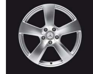
5-Speichen-Design (Code R32/R96)

* nähere Informationen siehe Seite 2 sowie bei Ihrem Mercedes-Benz Partner ACHTUNG: NoVA, Kraftstoffverbrauch und CO 2 -Emission abhängig von Getriebeart und Reifendimension