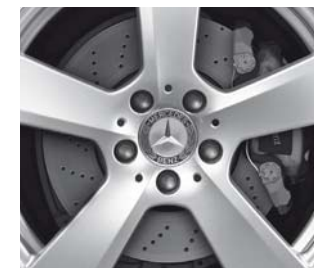
Bremsscheiben vorne gelocht