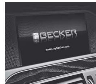
Becker® MAP PILOT