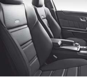
AMG Sportsitze vorne