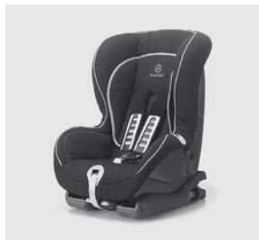
Kindersitz DUO plus