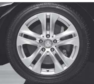
5-Doppelspeichen-Design (R 11)