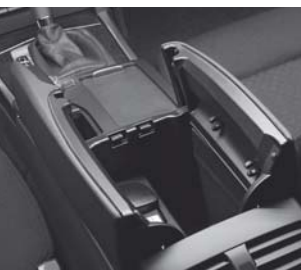
Ablagefach in Mittelkonsole