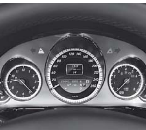
Kombiinstrument in Silber