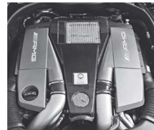
Motorabdeckung in Carbon