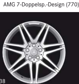
AMG 7-Doppelsp.-Design (770)