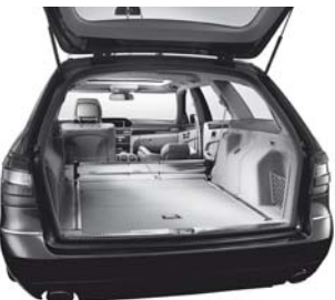
Easy-Pack-Fixkit und Ladekantenschutz