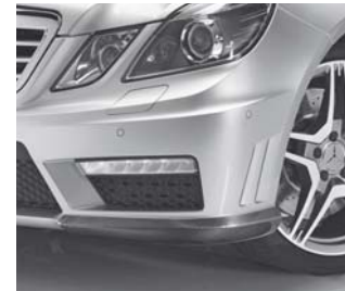
AMG Exterieur Carbonpaket