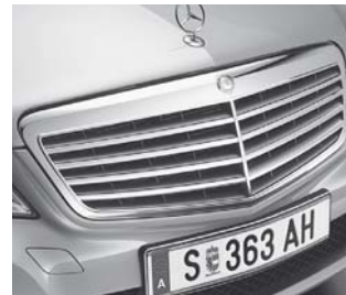
Kühlergrill silber lackiert