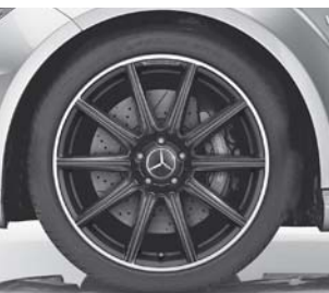
AMG Leichtmetallrad (752)