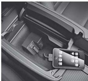
Media Interface (518) 1)