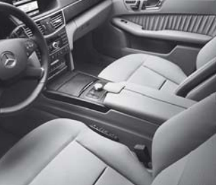
Polsterung Leder Nappa