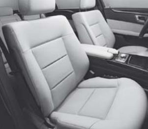
Polsterung Stoff Biarritz/ARTICO