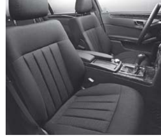
Polsterung Stoff Toulon