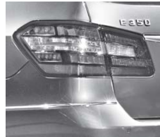
Heckleuchte in LED-Ausführung