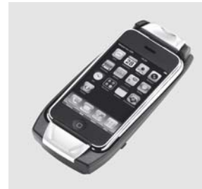
Aufnahmeschale für Apple iPhone